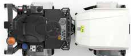
In-line 'one-side-free' configuratie